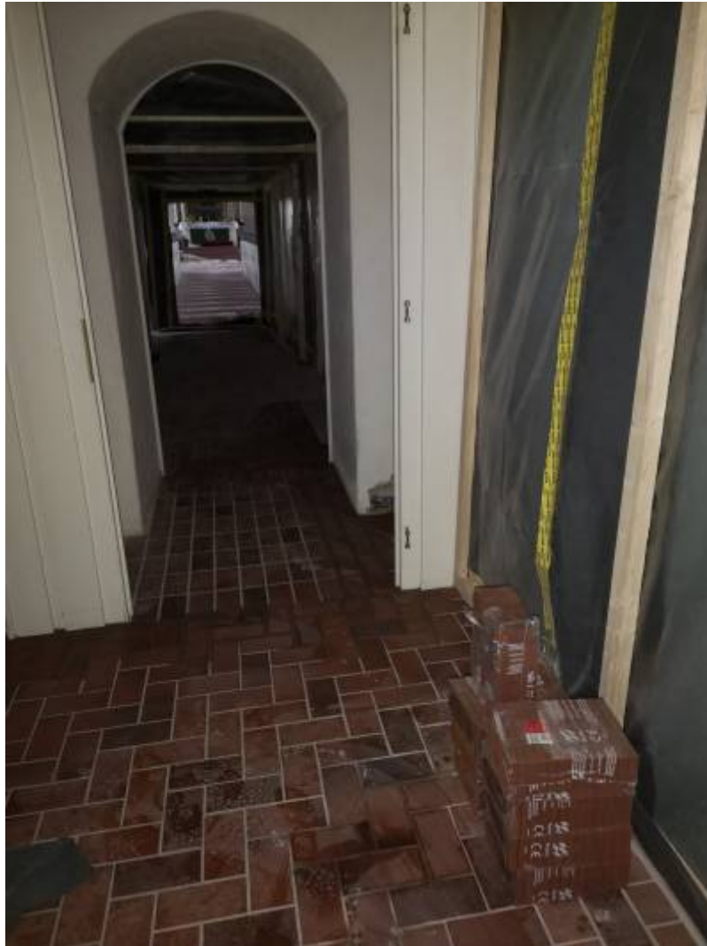
5. Februar abends: Die ersten Fliesen im Kirchenschiff sind verlegt, auch der Rahmen für den Revisionschacht zum Luftkanal ist schon eingebaut.