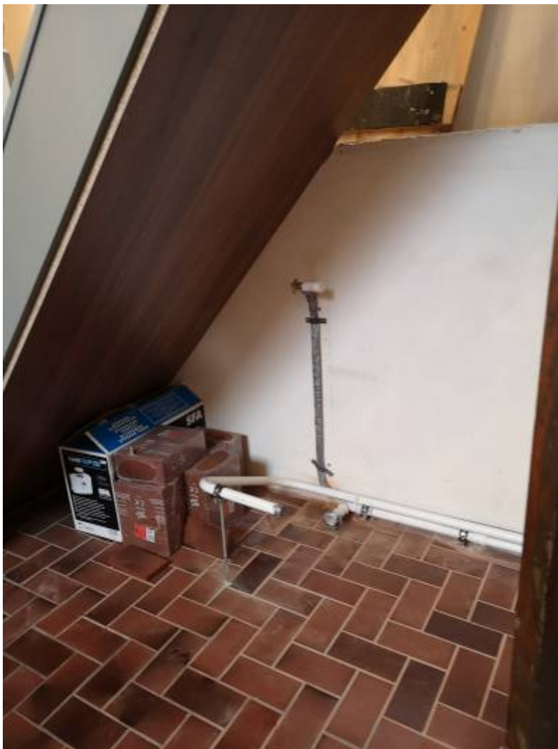
Mitte Februar: WC im Rohbau.